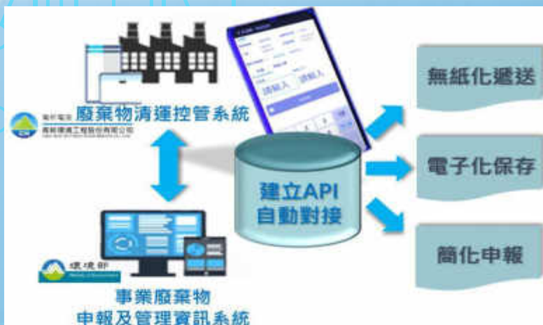
行動裝置六聯單電子化申報系統