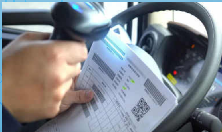
掃描聯單GPS即時定位

憑藉深耕多年的產業經驗與龐大的客戶基礎，事廢或是醫廢均穩定成長，未來將持續透過「青新」品牌效應，深化客戶關係並擴大服務版圖。