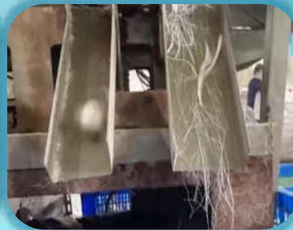
清洗、分選、切割、抽絲

整合既有客群與優化製程，透過「青新木」產品實現廢棄物高值化，建構完整的循環經濟商業模式。