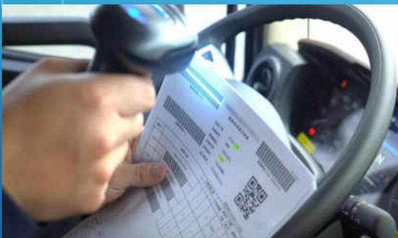
掃描聯單GPS即時定位