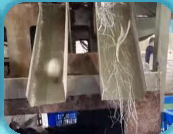
清洗、分選、切割、抽絲

整合既有客群與優化製程，透過「青新木」產品實現廢棄物高值化，建構完整的循環經濟商業模式。